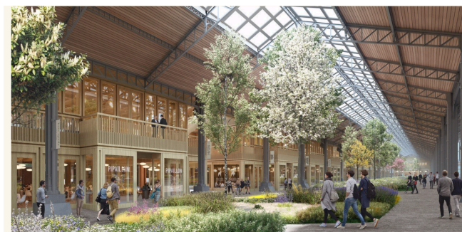
La halle centrale de la Gare Maritime. Elle devrait prochainement accueillir une halle gourmande. ©Neutelinks-Riedijk Architects

C'est le dernier arrivé en date dans le nouvel espace dédié aux entreprises sous les toits rénovés de deux des trois halles centenaires de la Gare Maritime. Et selon Kris Verhellen, le CEO d'Extensa, qui développe et gère les sites de Tour & Taxis, les derniers modules encore disponibles seraient désormais tous en phase de réservation par des candidats sérieux . Sur les 37.000 m 2 de bureaux et commodités disponibles à l'origine selon les plans des architectes de Neutelinks-Riedijk (NL), Bruxelles Formation en occupera dès l'automne prochain pas moins de 7.900 . Le service public régional rejoindra alors Publicis One et Accenture , les premiers confirmés, mais aussi Universal Music, Bosch Siemens, Colibra et un centre de coworking géré par l'enseigne Spaces (IWG -Regus) sur un module entier (4.435 m 2 ).