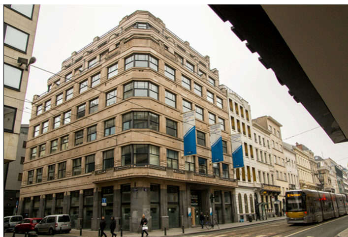
Le siège actuel de Bruxelles-Formation, sis au n°93 de la rue Royale, vient d'être mis en vente par Belsquare.

Parallèlement à l'aboutissement du contrat d'occupation signé par la direction de Bruxelles-Formation, le conseil en immobilier Belsquare, à la manoeuvre, confirme également avoir reçu mandat pour lancer la vente du siège actuel de l'organisme régional situé au 93 de la rue Royale. Cet immeuble d'angle Art déco (1930) logé non loin de la colonne du Congrès offre quelque 4.000 m 2 de bureaux. Pour emblématique qu'il soit, il a besoin d'une solide rénovation pour être remis aux standard du jour.